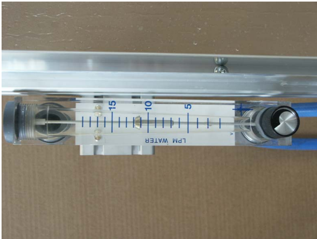
Měření průtoku vody do zkušební sprchové růžice.